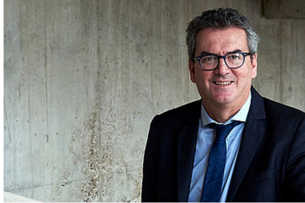
Biographie du Maire