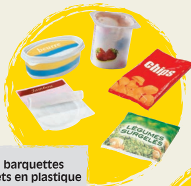
pots, barquettes et sachets en plastique