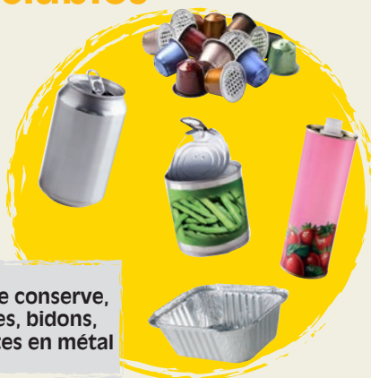
boîtes de conserve, canettes, bidons, barquettes en métal