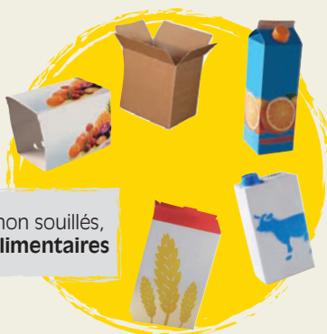
cartons non souillés, briques alimentaires