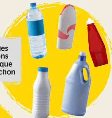
bouteilles et flacons en plastique avec bouchon