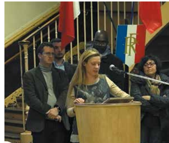
Une enseignante de l'école Charles-Auray est venue témoigner des réactions de ses élèves suite aux attentats.