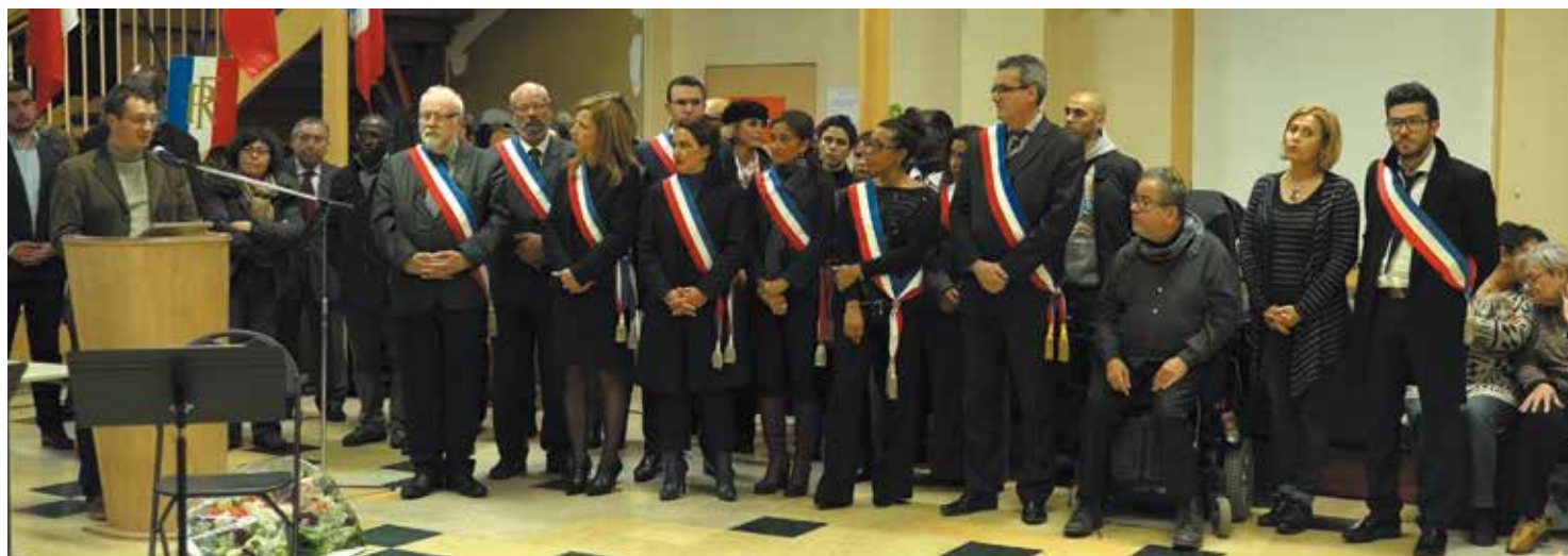
Les élus de Pantin avaient tenu à être présents.