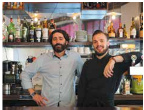
● Restaurant Le Quotidien 80 av. du Général-Leclerc ☎ 01 57 14 67 91