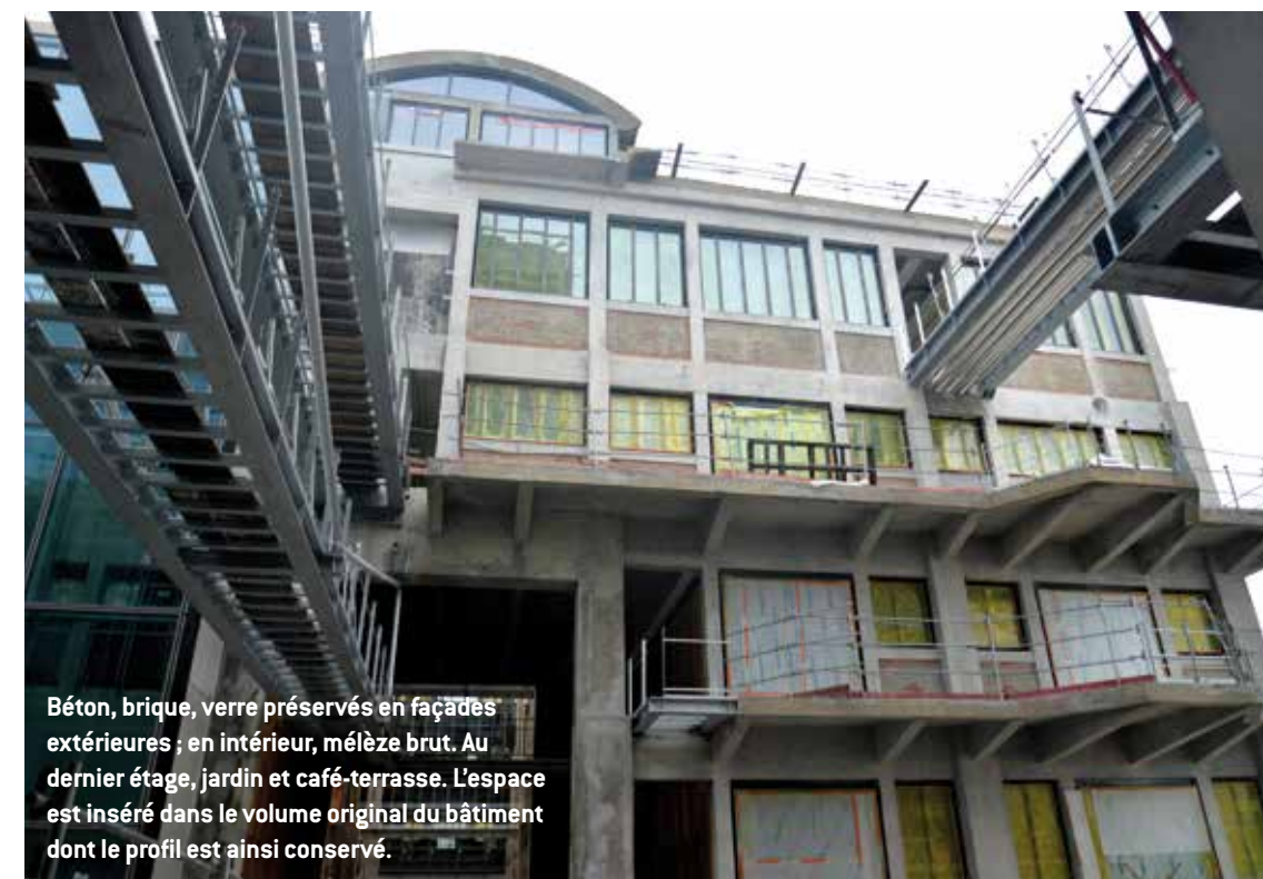
Béton, brique, verre préservés en façades extérieures ; en intérieur, mélèze brut. Au dernier étage, jardin et café-terrasse. L'espace est inséré dans le volume original du bâtiment dont le profil est ainsi conservé.

deux bâtisses : « L'ingénieur les a dessinés de façon très rationnelle, leur épaisseur s'affine à mesure que l'on monte dans les étages. On a choisi de les laisser en état, totalement bruts, y compris dans leurs stigmates et cicatrices. »