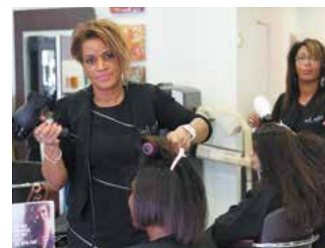
● Coiffure Mya Isai 153, avenue Jean-Lolive ☎ 01 48 00 00 00