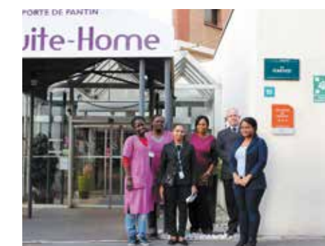
● Hôtel Suite-Home 25, rue Scandicci ☎ 01 49 42 85 85