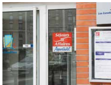
● Estudines Séjours et affaires 139, avenue Jean-Lolive ☎ 01 41 71 39 87