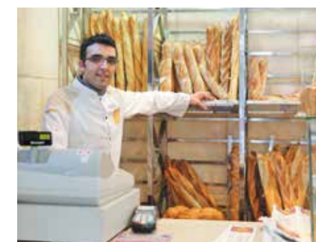
● Boulangerie Hoche 48, avenue Jean-Lolive ☎ 01 48 45 21 19