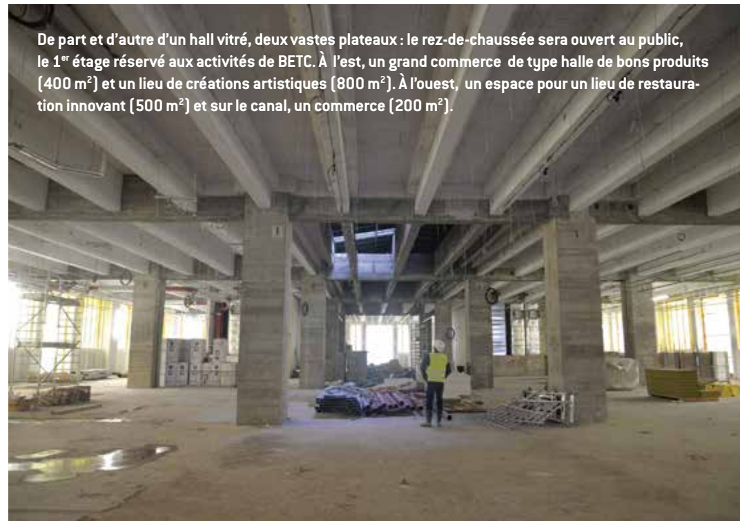
De part et d'autre d'un hall vitré, deux vastes plateaux : le rez-de-chaussée sera ouvert au public, le 1 er étage réservé aux activités de BETC. À l'est, un grand commerce de type halle de bons produits (400 m 2 ) et un lieu de créations artistiques (800 m 2 ). À l'ouest, un espace pour un lieu de restauration innovant (500 m 2 ) et sur le canal, un commerce (200 m 2 ).

« Il ne s'agit pas seulement d'un look brut et minimaliste, d'une esthétique industrielle qui en l'occurrence est à la mode, insiste Frédéric Jung. Ce qu'il y a d'extraordinaire dans la reconversion, c'est qu'on hérite d'une intention. Ici, on est dépositaire de la générosité du bâtiment : avec ses quatre façades en transparences, ses immenses baies vitrées flanquées de coursives, tous les usagers ont un même rapport au paysage, aux magnifiques perspectives sur le canal, Pantin, Romainville, Bobigny, Paris. Aucun salarié de BETC ne sera puni ! » Le choix a également été fait de préserver quelques éléments de signalé-