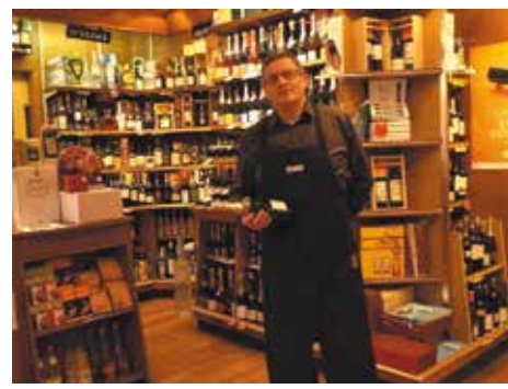
● Vins Nicolas 45, avenue Jean-Lolive ☎ 01 48 45 19 77