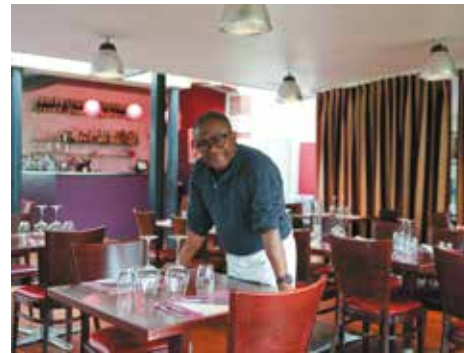
● Restaurant Le Plate's 140, avenue Jean-Lolive ☎ 01 57 42 93 14