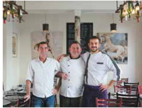
● Restaurant Le P'tit Classé 6, rue Victor-Hugo ☎ 01 57 14 38 74