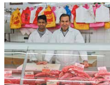
● Boucherie Saray 115, avenue Jean-Lolive ☎ 01 48 10 05 56