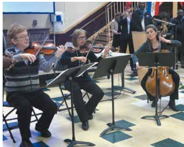
Des musiciens du CRD (Conservatoire à Rayonnement Départemental) ont accompagné ce moment d'émotion.