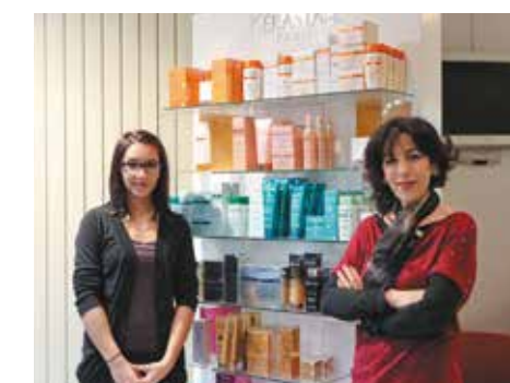
● SG coiffure 79, avenue Edouard-Vaillant ☎ 01 48 46 20 20