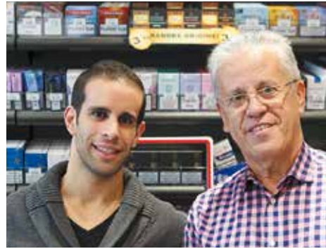
● Presse-Tabac Au petit tabac 2, avenue Edouard-Vaillant ☎ 01 41 71 06 44