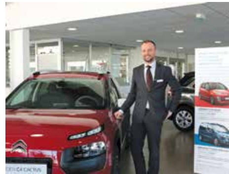
● Citroën Pantin 68 av. du Général Leclerc ☎ 01 49 15 10 04