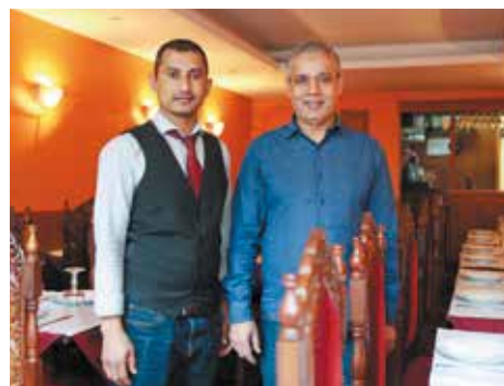
● Restaurant Lakshmi 37, rue du Pré-Saint-Gervais ☎ 01 48 95 28 36