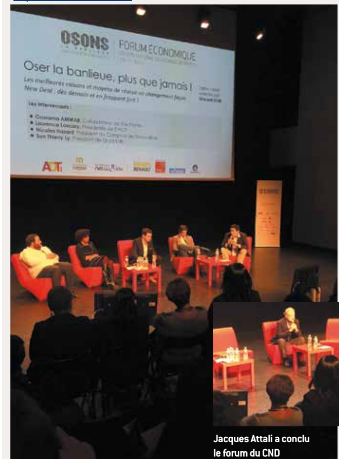
Jacques Attali a conclu le forum du CND